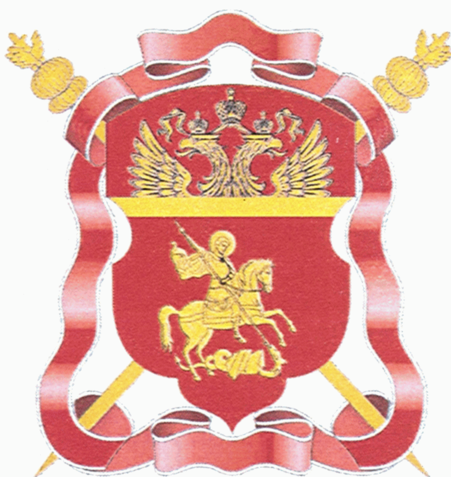
РИСУНОК герба войскового казачьего общества «Центральное казачье войско»

Указом Президента Российской Федерации от 9 февраля 2010 г. № 168 (в редакции Указа Президента Российской Федерации от 14 октября 2010 г. № 1240)